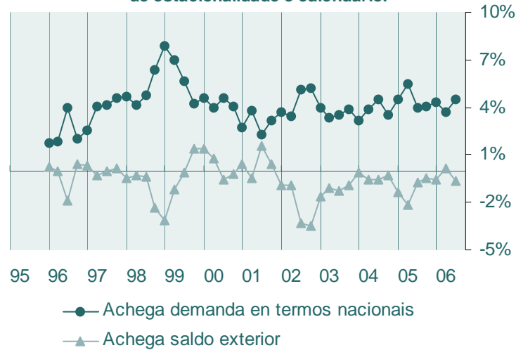
Volumen encadeado referencia 2000. Datos corrixidos de estacionalidade e calendario.